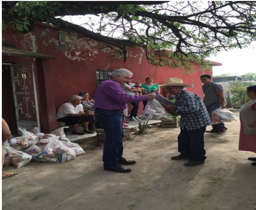
EN LA COMUNIDAD DE PASAJE, MUNICIPIO DE CUENCAMÉ SE APOYÓ CON COBIJAS Y DESPENSAS.