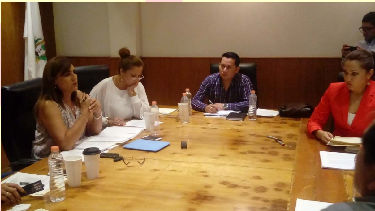
REUNIÓN DE LA COMISIÓN DE HACIENDA, PRESUPUESTO Y CUENTA PÚBLICA

En la participación activa de esta Comisión se asistió a veintiséis reuniones de trabajo, en las cuales se abordaron temas trascendentales como, la aprobación de las Leyes de Ingresos y presupuestos de Egresos de todos los municipios, así como la Ley de Ingresos y presupuesto de Egresos del Estado, para el ejercicio fiscal 2017: