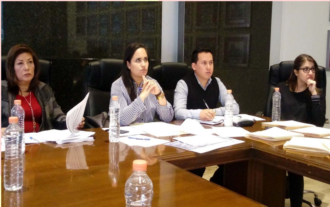
REUNIÓN DE LA COMISIÓN JUVENTUD Y DEPORTE 14 MARZO DE 2017