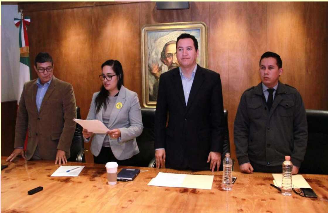
REUNIÓN DE LA COMISIÓN DE ATENCIÓN CIUDADANA