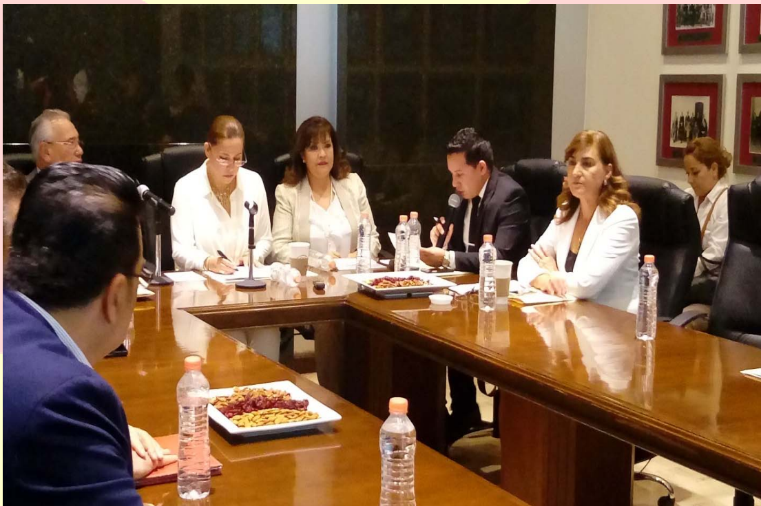
REUNIÓN DE TRABAJO DE LA COMISIÓN DE SALUD CON AUTORIDADES DEL SECTOR SALUD