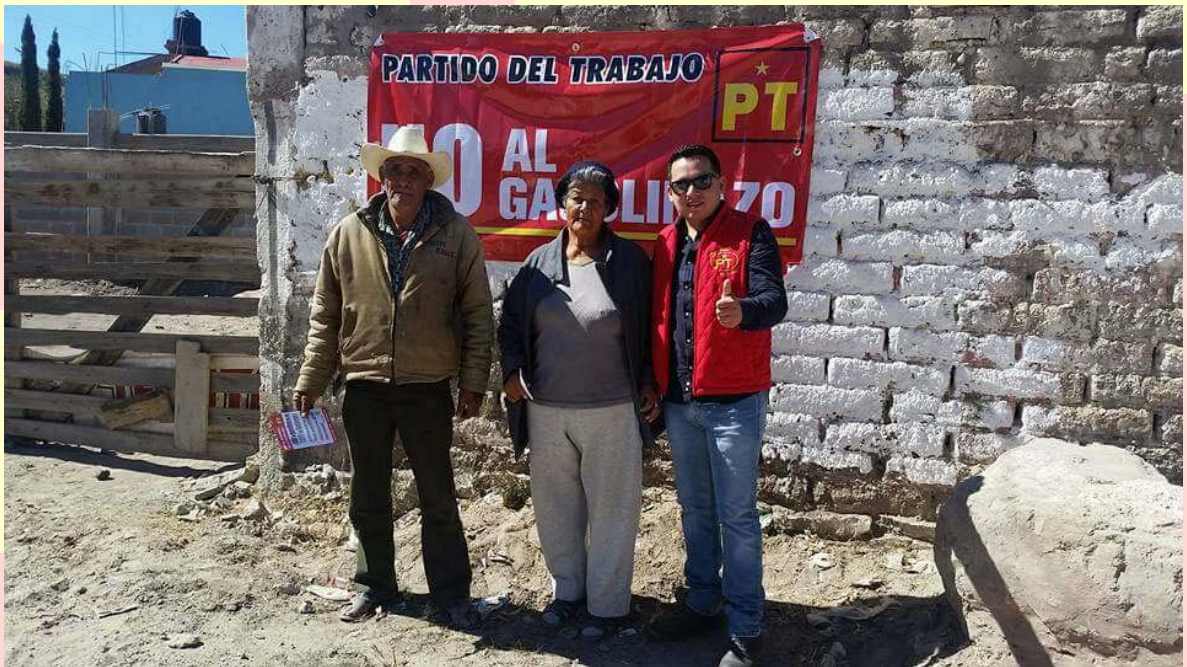
TOTAL RECHAZO AL AUMENTO DEL PRECIO DE LOS COMBUSTIBLES