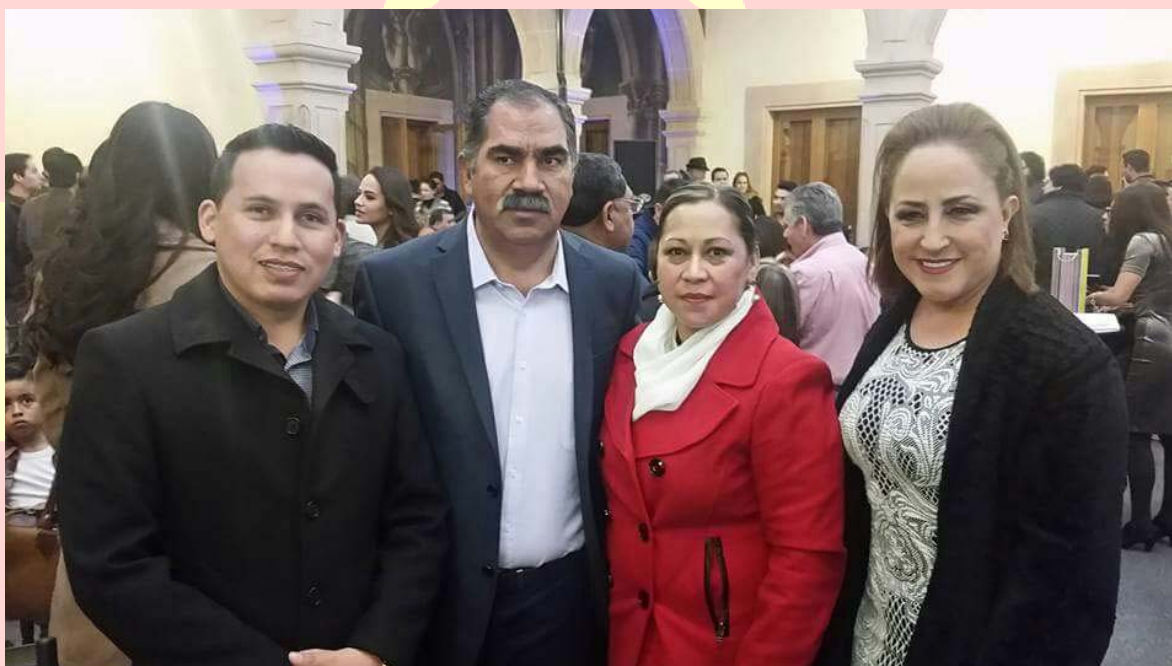
APOYO AL MUNICIPIO DE NOMBRE DE DIOS PARA QUE SE CONVIERTA EN “PUEBLO MÁGICO”