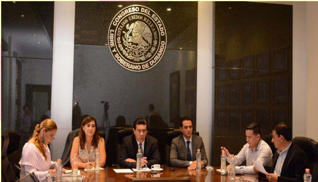
REUNIÓN DE LAS COMISIONES UNIDAS DE JUSTICIA Y HACIENDA, PRESUPUESTO Y CUENTA PÚBLICA

Uno de los temas más importantes que se ha tratado en esta Comisión es la de la elección de la Comisión de Selección del Consejo de Participación Ciudadana del Sistema Local Anticorrupción: