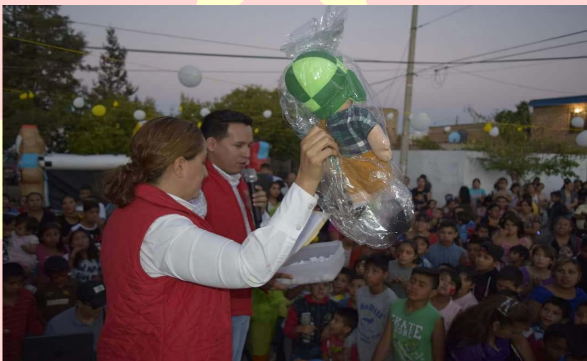
FESTEJO DEL DÍA DEL NIÑO ABRIL DE 2017