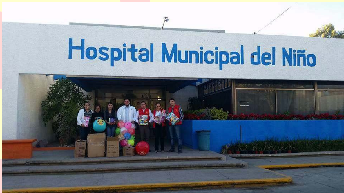
ENTREGA DE JUGUETES A NIÑOS ENFERMOS INTERNADOS EN EL HOSPITAL DEL NIÑO