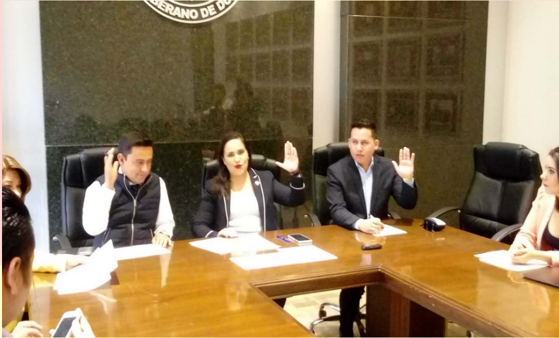
REUNIÓN DE LA COMISIÓN DE JUVENTUD Y DEPORTE