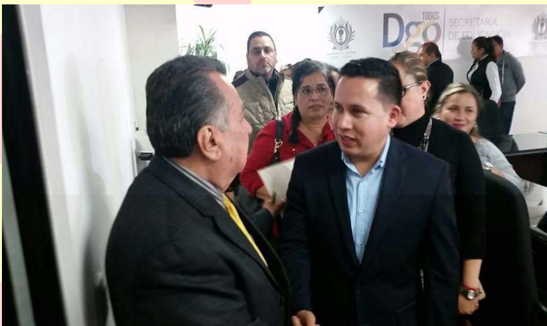
DIÁLOGO CON LAS AUTORIDADES CORRESPONDIENTES PARA AUMENTAR EL PRESUPUESTO DE LOS CADÍ