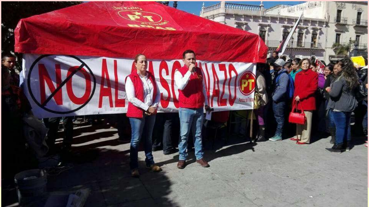
RECOLECCIÓN DE FIRMAS PARA UN RECHAZO TOTAL AL AUMENTO DEL PRECIO DE LOS COMBUSTIBLES