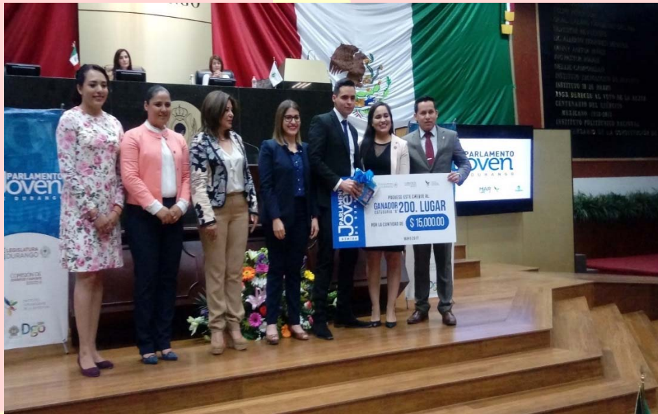
PREMIACIÓN 2DO. LUGAR