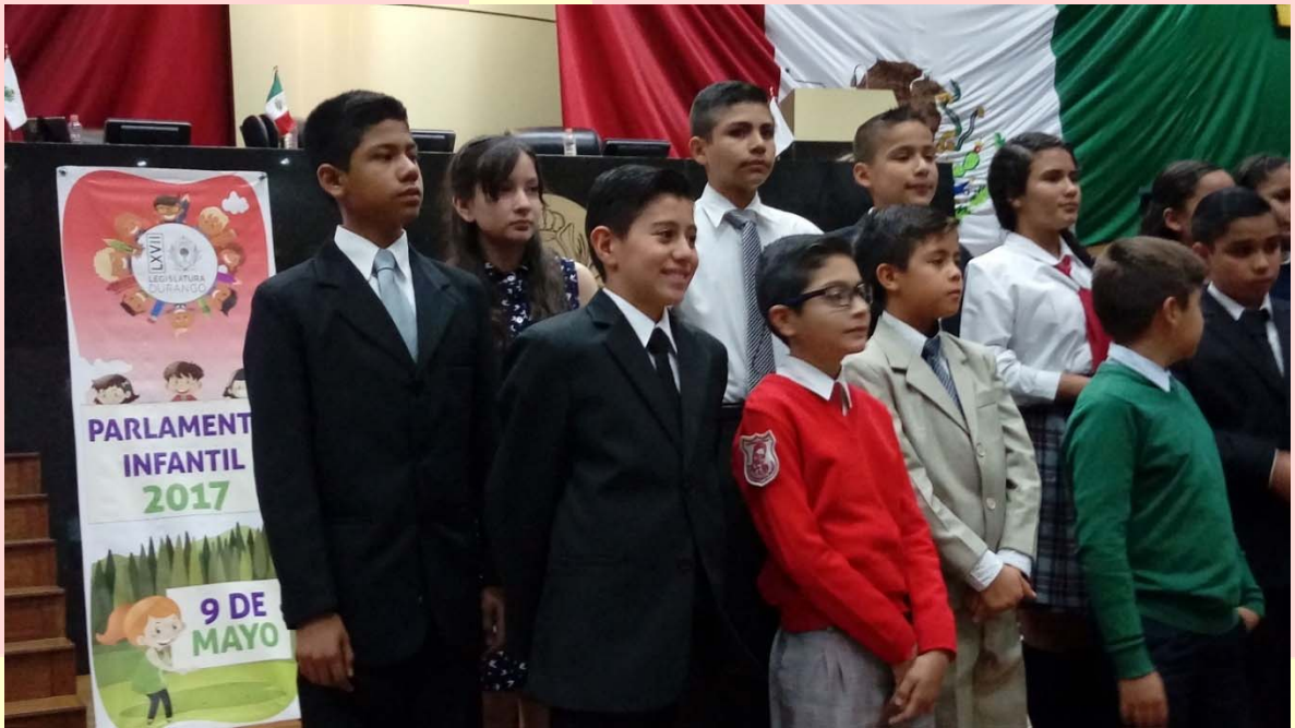
PARLAMENTO INFANTIL 2017