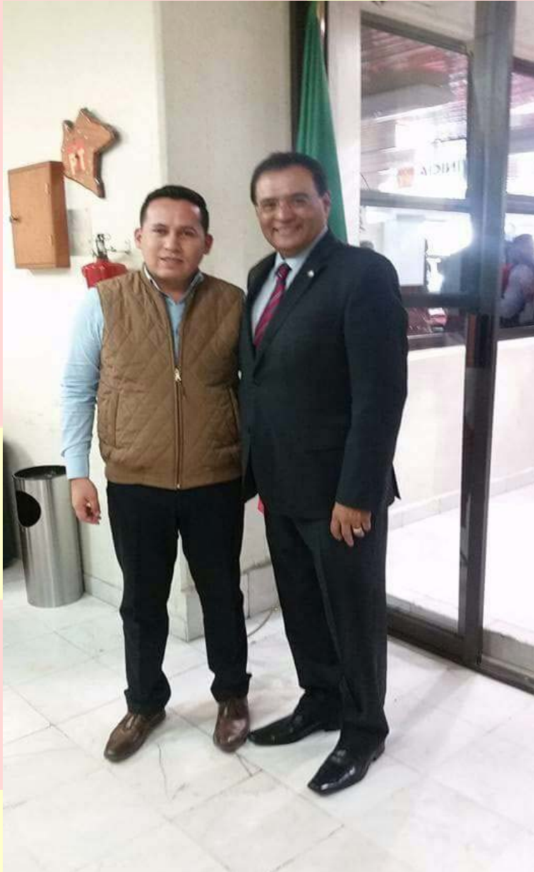
TRABAJANDO CON EL SENADOR BENJAMÍN ROBLES POR EL PARTIDO DEL TRABAJO