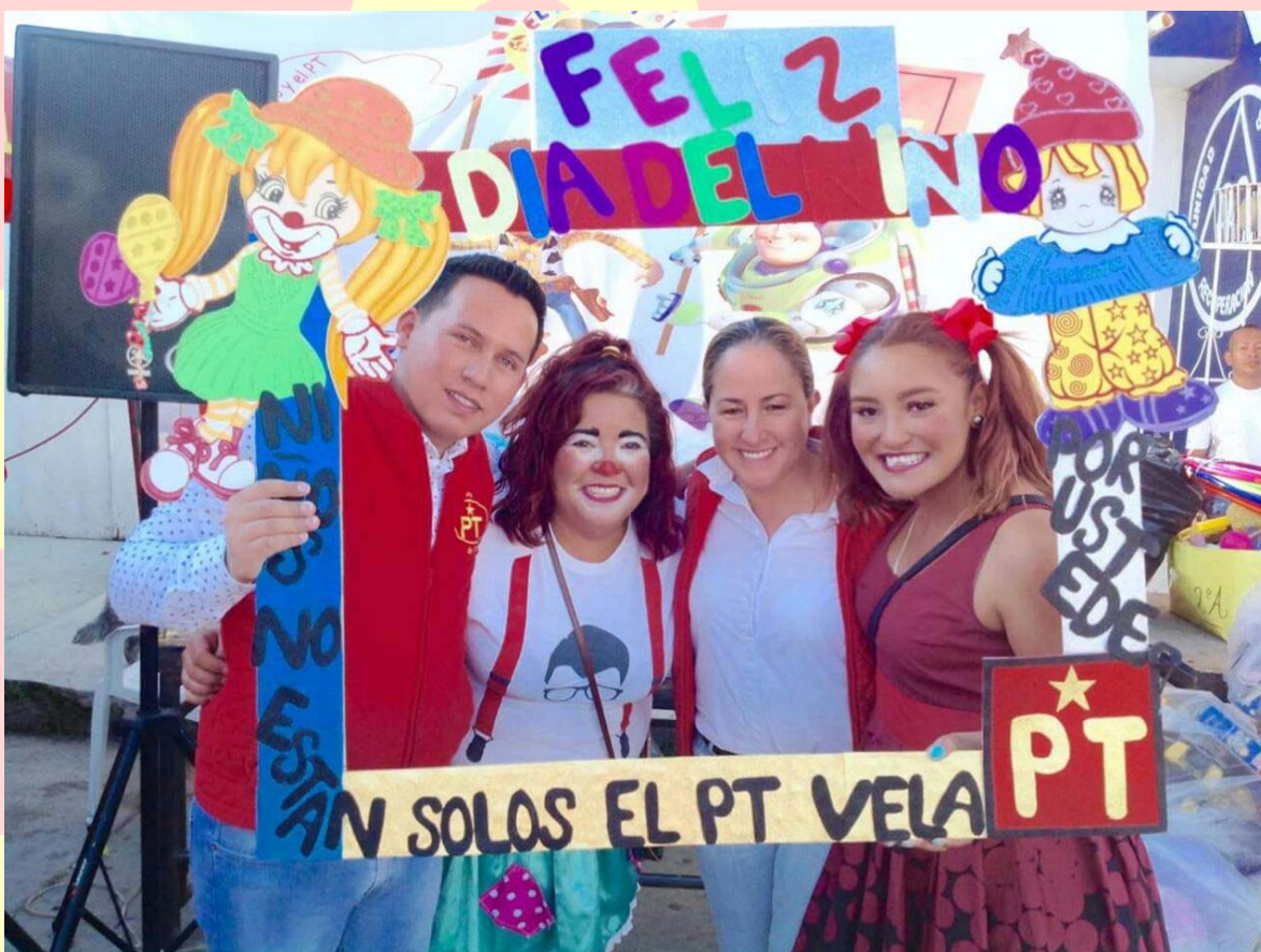
FESTEJO DEL DÍA DEL NIÑO ABRIL DE 2017

FESTEJO DEL DÍA DEL NIÑO PARA HABITANTES DE LAS COLONIAS DE LA PERIFERIA DE LA CIUDAD, EN DONDE SE REPARTIERON AGUINALDOS, GOLOSINAS, MUCHA DIVERSIÓN Y MILES DE SONRISAS!!