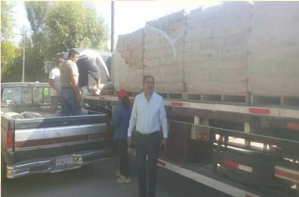
APOYO DE MATERIAL DE CONSTRUCCIÓN PARA REHABILITAR VIVIENDAS DE PERSONAS DE MUY ESCASOS RECURSOS ECONÓMICOS, EN LOS DIFERENTES MUNICIPIOS