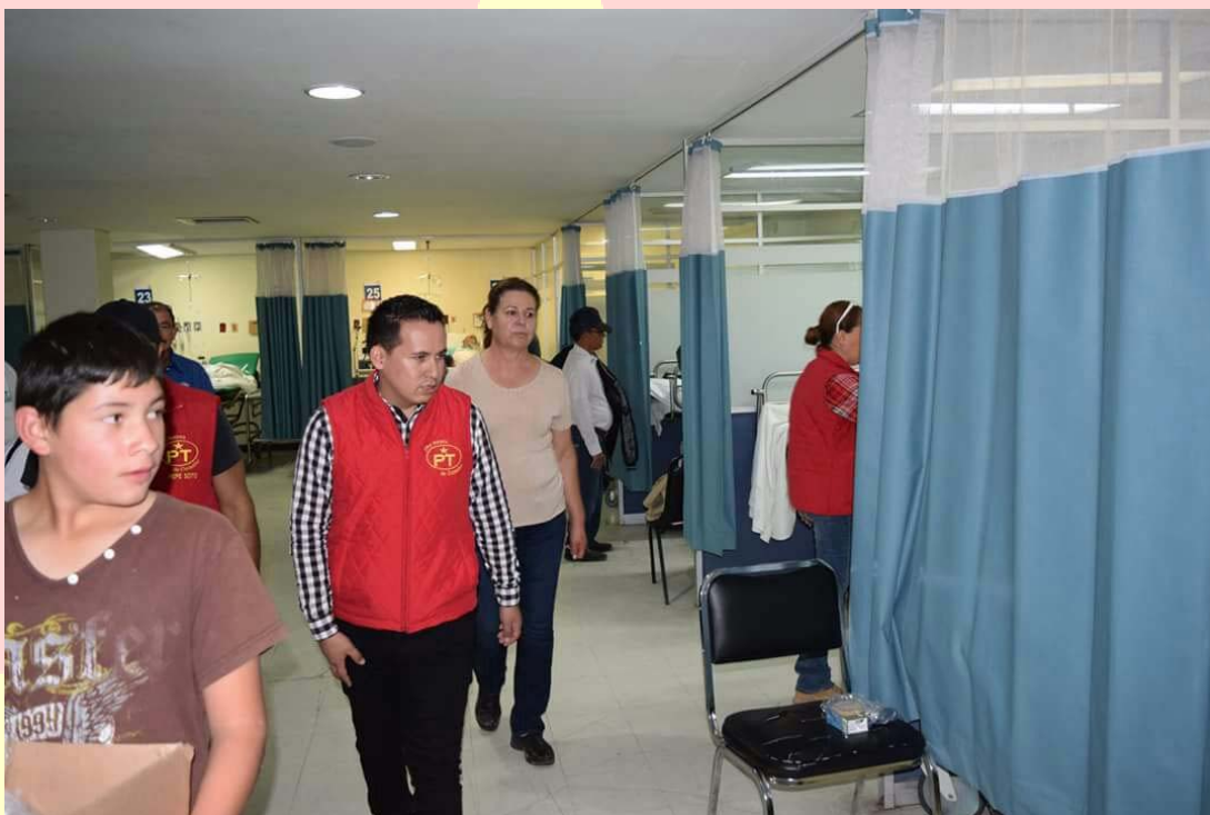
RECORRIDO A HOSPITALES PARA LA ENTREGA DE APOYOS ALIMENTARIOS