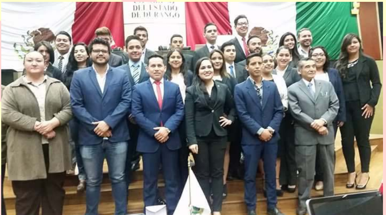
JURADO PARLAMENTO JOVEN 2017