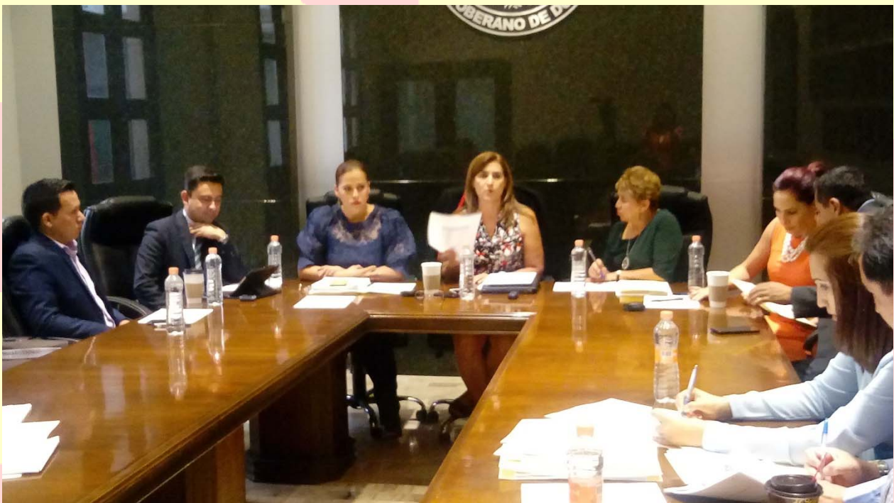
REUNIÓN DE LA COMISIÓN DE HACIENDA, PRESUPUESTO Y CUENTA PÚBLICA