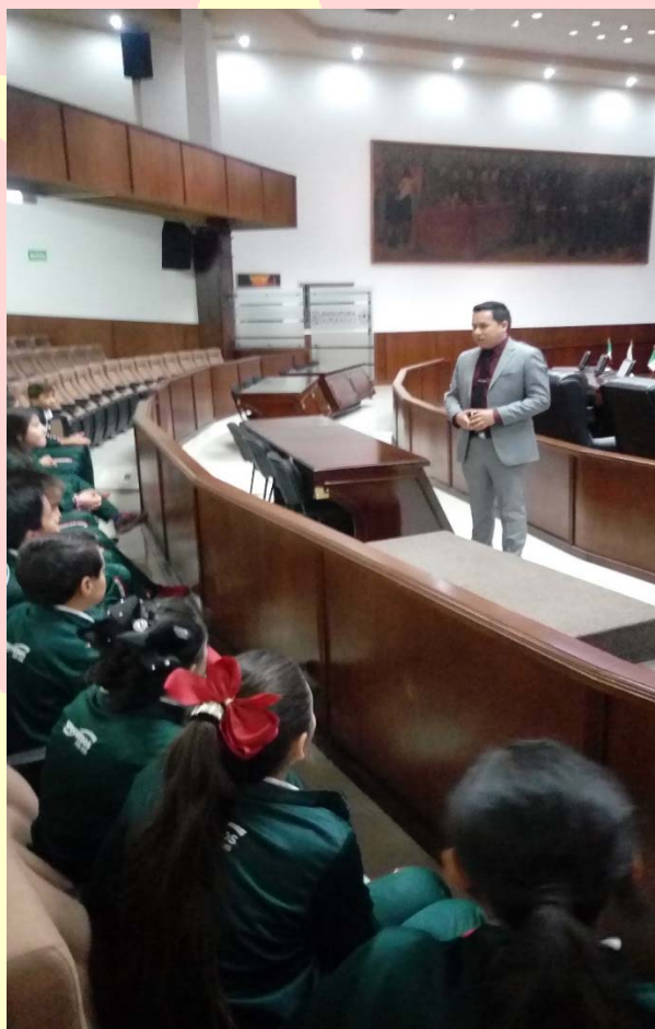
ATENCIÓN Y APOYO A NIÑOS DE ESCUELAS DE LA PERIFERIA DE LA CIUDAD