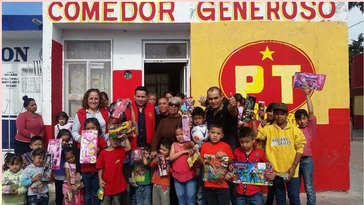
ENTREGA DE JUGUETES A NIÑOS DE MUY ESCASOS RECURSOS QUE ACUDEN A ALIMENTARSE A LOS COMEDORES COMUNITARIOS DEL PARTIDO DEL TRABAJO