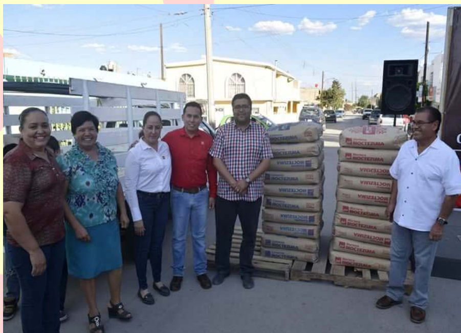
APOYO CON MATERIAL DE CONSTRUCCIÓN PARA LA REHABILITACIÓN DE LA IGLESIA DE LA COL. EMILIANO ZAPATA