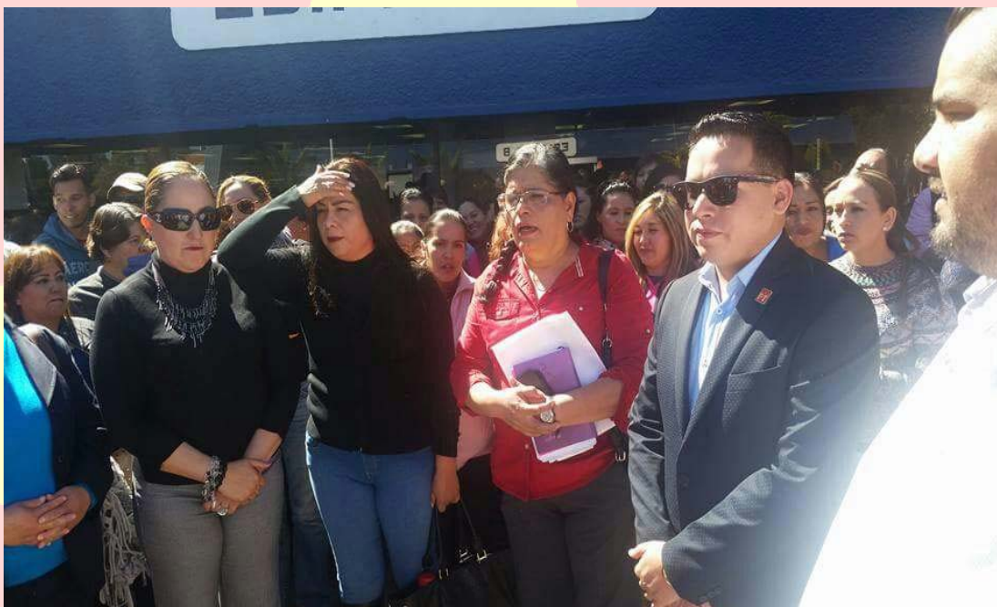
DIÁLOGO CON LAS AUTORIDADES CORRESPONDIENTES PARA AUMENTAR EL PRESUPUESTO DE LOS CADI