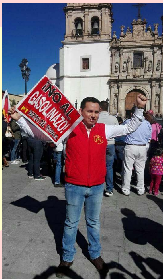
TOTAL RECHAZO AL AUMENTO DEL PRECIO DE LOS COMBUSTIBLES