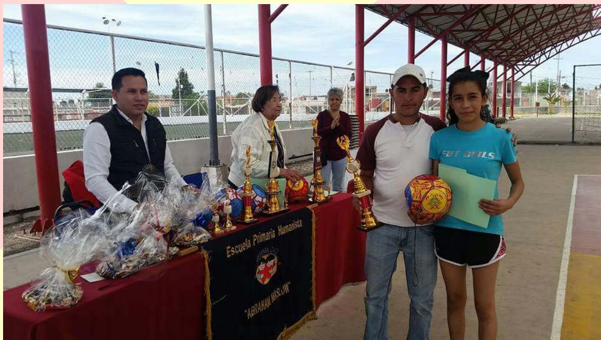
TROFEOS Y MATERIAL DEPORTIVO