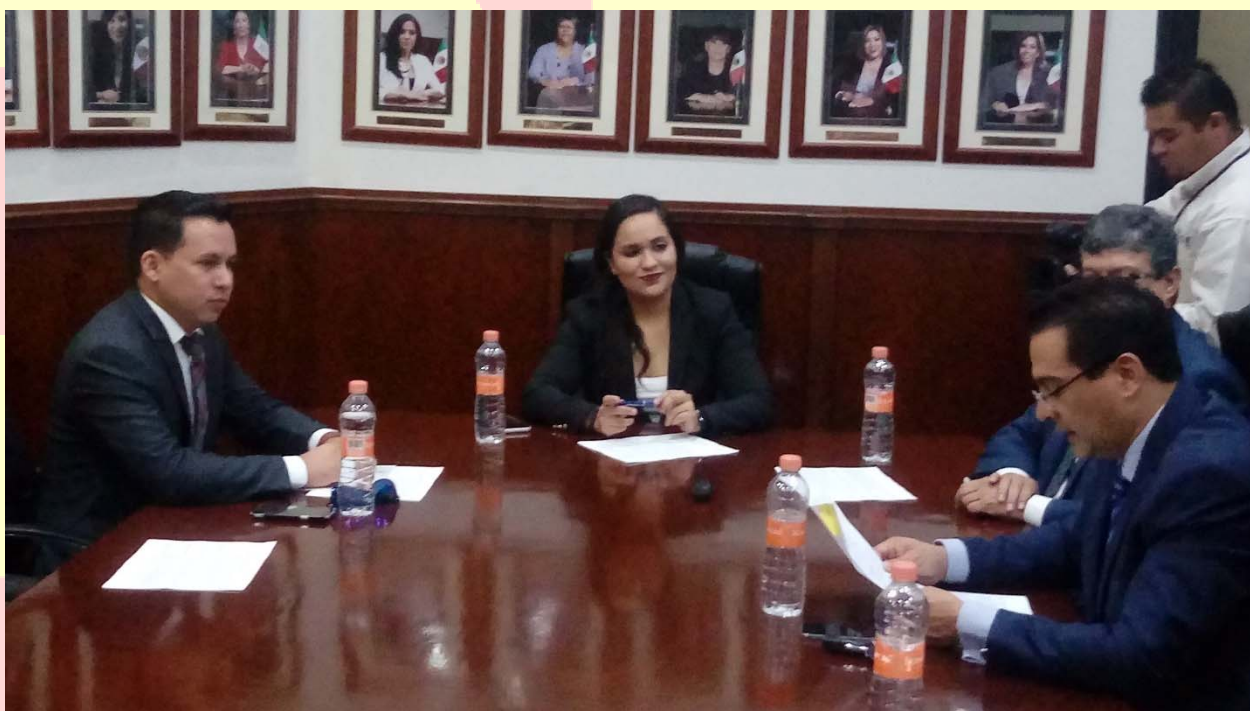
REUNIÓN DE LA COMISIÓN DE ATENCIÓN CIUDADANA

Si bien la gestoría y la atención ciudadana no es la labor fundamental de un legislador, sin embargo no podemos negar que la cercanía con la ciudadanía permite resolver con mayor efectividad las necesidades sociales, siempre con el único interés de ayudar y tener una comunicación directa sobre las difíciles situaciones que vive nuestra gente buscando mejores resultados en nuestro trabajo diario, en esta Comisión sesionamos 4 veces: