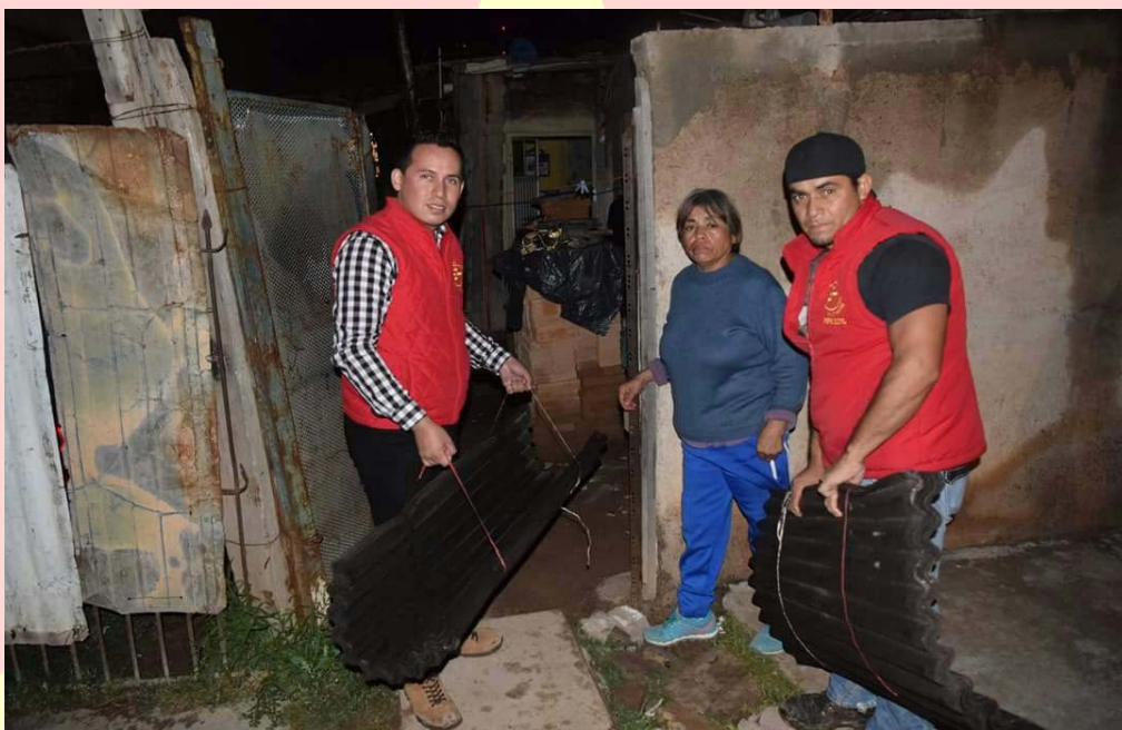
APOYO CON LÁMINAS Y HULE A PERSONAS CON VIVIENDAS EN MALAS CONDICIONES