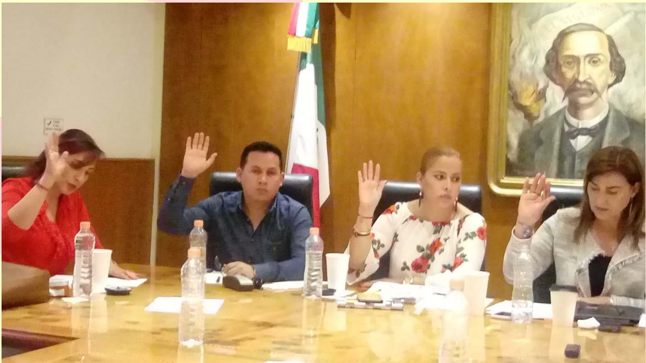
REUNIÓN DE LA COMISIÓN DE SALUD