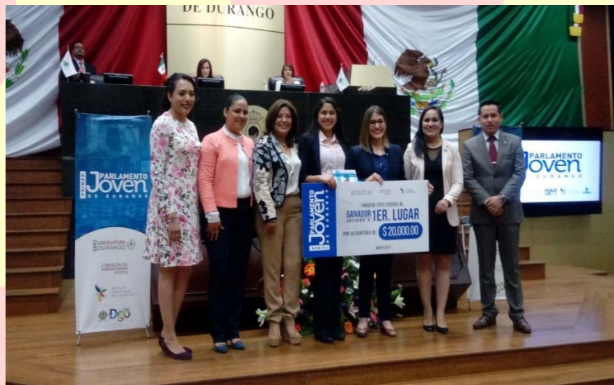
PREMIACIÓN 1ER. LUGAR