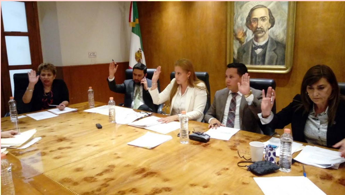
REUNIÓN DE LA COMISIÓN DE SALUD