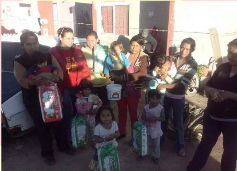
APOYO DE PAÑALES A MADRES SOLTERAS