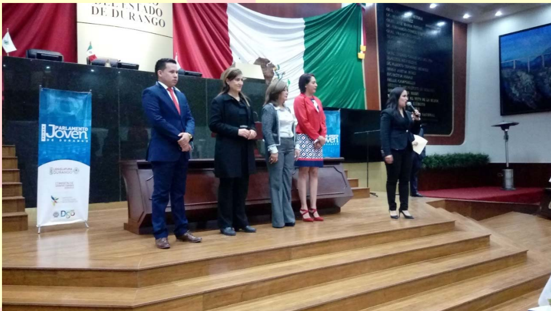
PREMIACIÓN PARLAMENTO JOVEN 2017