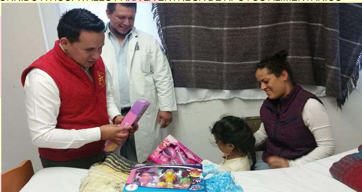
ENTREGA DE JUGUETES A NIÑOS INTERNADOS CON TRATAMIENTO MÉDICO