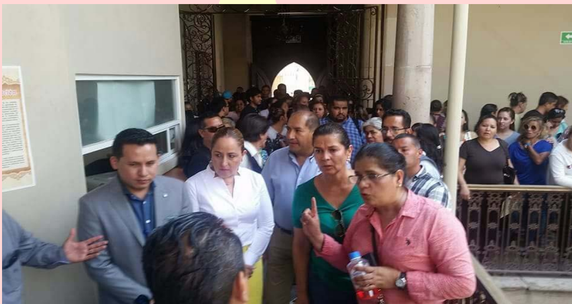
SOLICITANDO LIBERACIÓN DE RECURSOS PENDIENTES DEL CADÍ