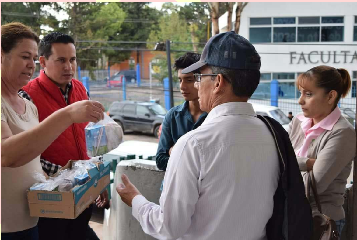
ENTREGA DE PAQUETES ALIMENTARIOS

RECORRIDOS EN HOSPITALES ENTREGANDO PAQUETES ALIMENTARIOS A PACIENTES DE ENFERMOS INTERNADOS, CON EL ÚNICO OBJETIVO DE ATENUAR SU DIFÍCIL ESTANCIA: