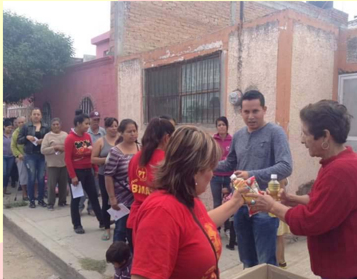
APOYO ALIMENTARIO A JEFAS DE FAMILIA EN DIVERSAS COLONIAS DE LA PERIFERIA DEL MUNICIPIO DE DURANGO