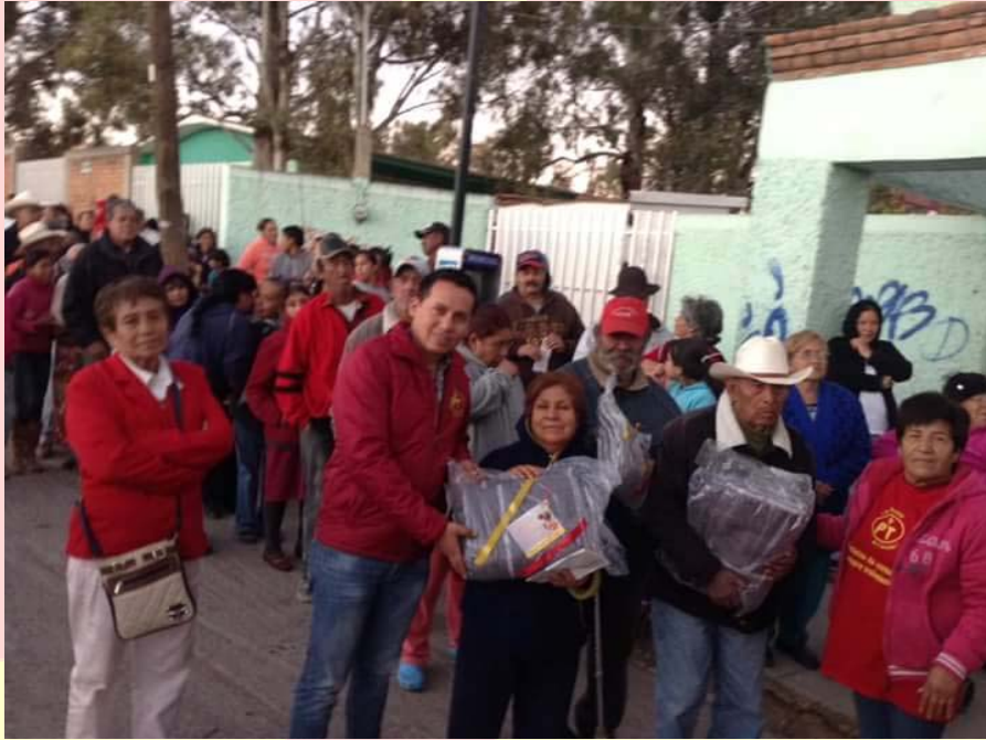
APOYO CON COBIJAS A PERSONAS DE LA TERCERA EDAD EN SITUACIÓN VULNERABLE A LAS CONTINGENCIAS DEL INVIERNO