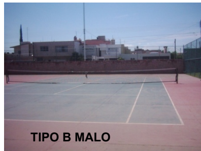
TIPO B MALO