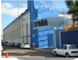
DE CALIDAD MALO