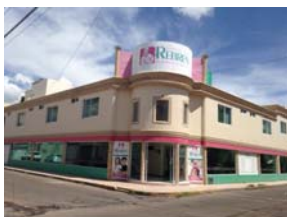
DE LUJO MALO