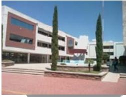
DE CALIDAD BUENO