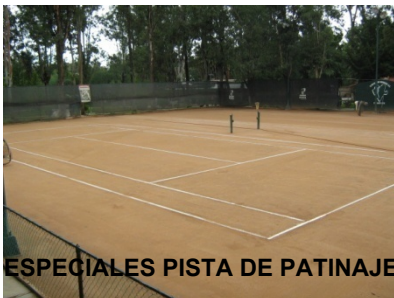
ESPECIALES PISTA DE PATINAJE