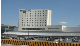
DE CALIDAD BUENO