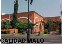
DE CALIDAD MALO