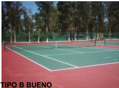
TIPO B BUENO