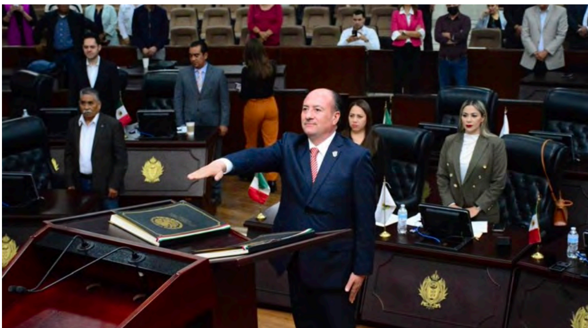
TOMA DE PROTESTA DEL CIUDADANO LIC. NOEL DÍAZ RODRÍGUEZ COMO FISCAL ESPECIALIZADO EN COMBATE A LA CORRUPCIÓN EN EL ESTADO (27 DE NOVIEMBRE DE 2024)