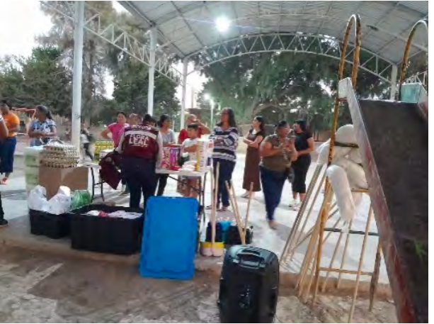
Ejido La Luz