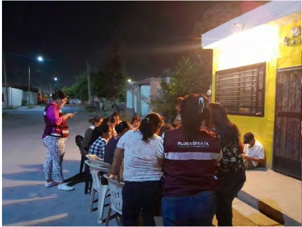
Col. San Felipe

Presente con la tiendita del pueblo en apoyo a la economía de los habitantes de: