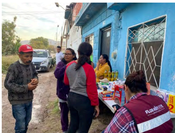
Col. Ernesto Zedillo