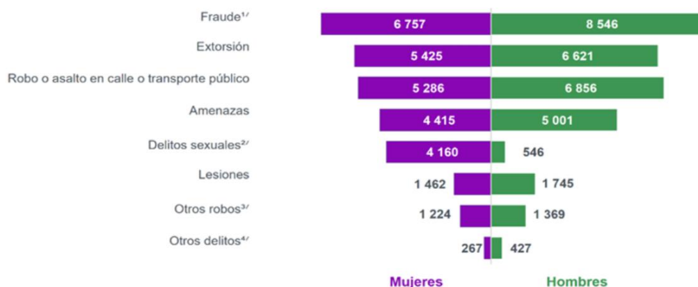
Gráfica 1 Tasa de delitos por cada 100 mil habitantes, según tipo de delito y sexo de la víctima 2024

Nota: Al presentar la tasa de delitos según sexo de la víctima, se excluyen los delitos del hogar: robo total o parcial de vehículo y robo a casa habitación . En estos casos, todas y todos los integrantes del hogar son víctimas, sin hacer distinción de sexo o edad.