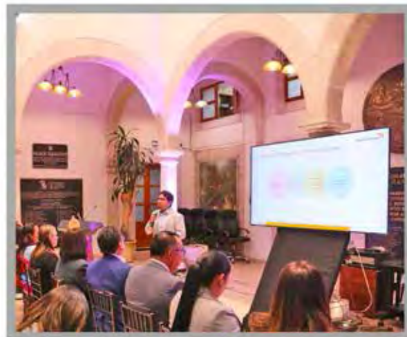
DESARROLLO DEL TALLER