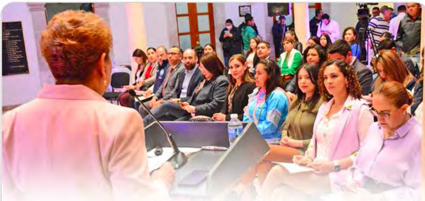
MENSAJE DE BIENVENIDA Y PARTICIPANTES DEL TALLER