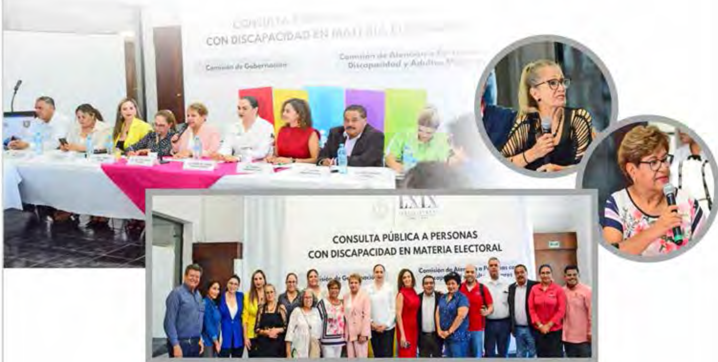
ASISTENTES A CONSULTA PÚBLICA

Asistieron representantes asociaciones civiles, así como la Magistrada Presidenta del Tribunal Electoral del Estado, representante del Ayuntamiento de Gómez Palacio, DIF Municipal, CREE y diputados integrantes de la comisión.