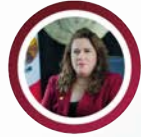
DIP. ALEJANDRA DEL VALLE RAMÍREZ