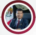
DIP. EDUARDO GARCÍA REYES