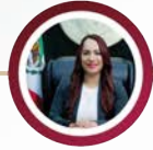
DIP. SANDRA LILIA AMAYA ROSALES