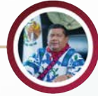
DIP. BERNABÉ AGUILAR CARRILLO