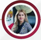
DIP. OFELIA RENTERÍA DELGADILLO