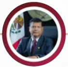
DIP. EDUARDO GARCÍA REYES