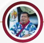
DIP. BERNABÉ AGUILAR CARRILLO