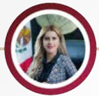
DIP. OFELIA RENTERÍA DELGADILLO