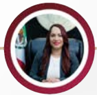
DIP. SANDRA LILIA AMAYA ROSALES